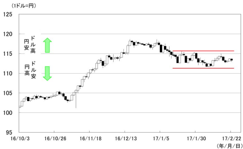
図表3 ドル円の推移 (2016年10月3日～2017年2月22日)

為替市場では、1月中旬以降、ドル円（ドルの対円レート）がレンジ内（1ドル111円台半ば～115円台半ば）でのみみ合いに終始しています。ドル円の上昇要因と下落要因が混在する中、市場参加者の強弱感が対立するとともに、短期的にその力が拮抗しているためと思われます。しかし、足元ではユーロが対円でやや軟調に推移しており、全般的に円高圧力が強まりつつあると思われま