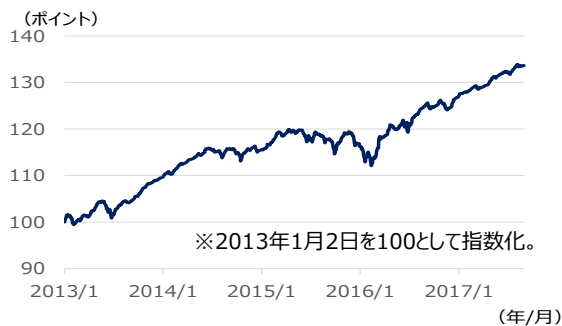
【図表3】欧州ハイ・イールド債券指数の推移 (2013年1月2日～2017年8月31日、日次)