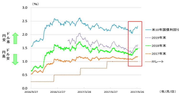
図表2 米10年国債利回りとFFレート先物市場に 織り込まれる政策金利見通しの推移 (2016年9月27日～2017年9月27日、日次)

※FFレート:フェデラル・ファンド・レート(=米国の政策金利) ※図中のFFレートは、誘導目標水準の下限を表示