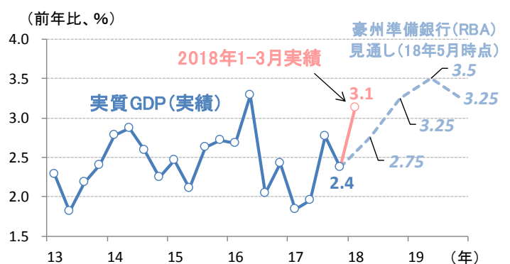
図3: 豪州の実質GDP成長率の実績とRBA予想

RBAが今後、豪州景気の拡大に対する自信を深めれば、現行の中立的な金融政策を見直す議論に繋がる可能性もありそうです。