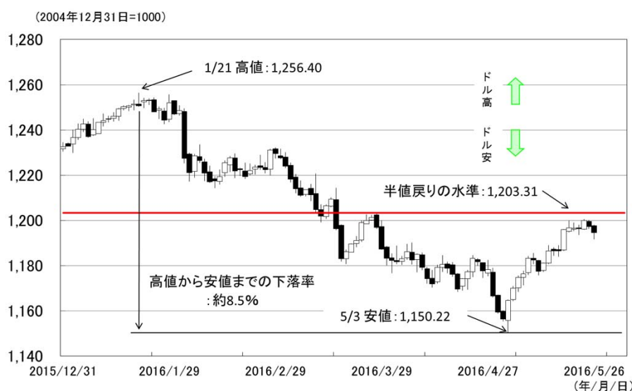
図表1 昨年末以降のドル加重平均指数の推移 (2015/12/31～2016/5/26)

※ドル加重平均指数:ブルームバーグドル・スポット指数 (指数構成比は、先進国通貨6通貨で81.6%、新興国通貨4通貨で18.4%)