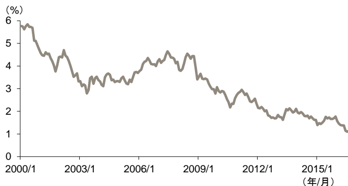
世界債券の利回り推移(期間:2000年1月末~2016年8月末)

2008年のリーマンショック以降、各国での経済成長鈍化やインフレ期待の低下等を背景に、世界の債券市場の利回りは低下傾向を辿ってきました。最近では欧州中央銀行 (ECB) や日銀のマイナス金利導入の影響もあり、投資家の利回り追求の動きが強まって、利回りが一段と低下しています。このような環境下、米ドル建てアジア・ハイ・イールド債券の利回りは相対的に高い水準にあり、今後より一層投資家の注目が集まると考えられます。