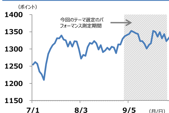
TOPIX（東証株価指数）の推移

（期間）2016年7月1日～2016年10月4日、日次