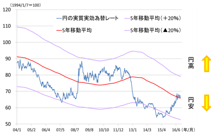
図表3 円の実質実効為替レートと5年移動平均との乖離 (2004年1月2日～2016年10月14日)